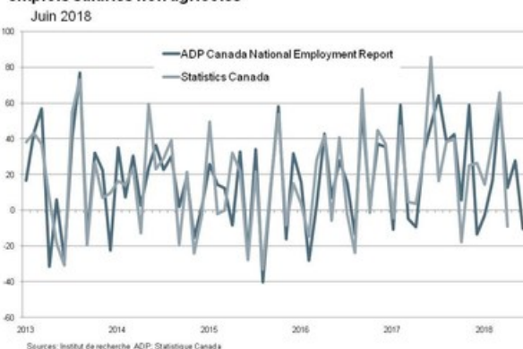
Graphique 2. Tendence historique – Évolution de l'ensemble des emplois salariés non agricoles