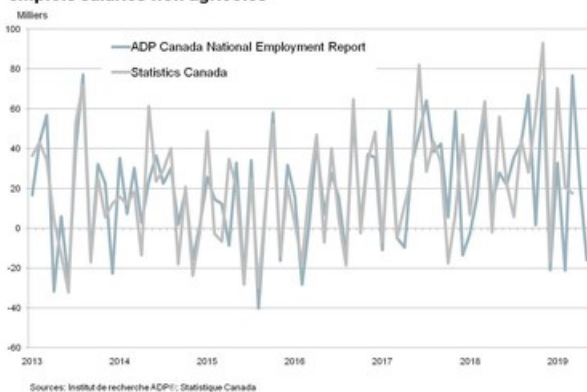
Graphique 2. Tendence historique – Évolution de l'ensemble des emplois salariés non agricoles