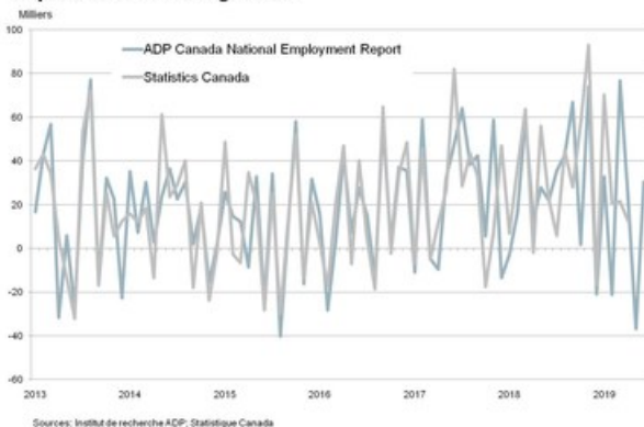
Graphique 2. Tendence historique – Évolution de l'ensemble des emplois salariés non agricoles